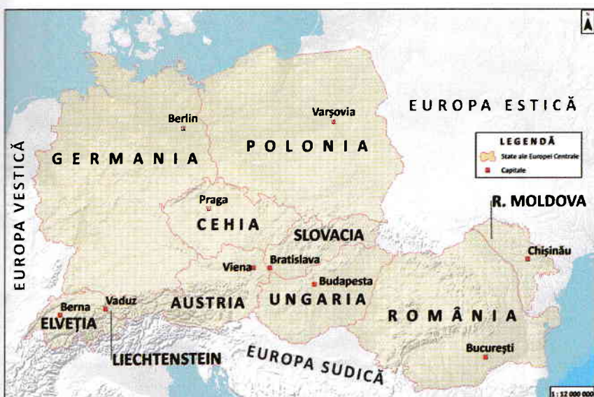
Fig. 3. România – țară central-europeană

În afară de poziția geografică pe continent, care atestă apartenența țării noastre la Europa Centrală (fig. 3), și celelalte elemente naturale și antropice subscriu acestui fapt (vezi Aprofundez ).