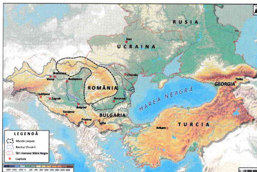
Fig. 1. România – țară carpatică, dunăreană, pontică

În plus, dealurile, podișurile și câmpiile dispuse la exterior s-au format prin depunerea sedimentelor erodate și transportate din Carpați, deci pământul românesc este de origine carpatică (cu excepția câtorva